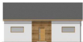
Pohled boční zleva