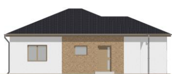
Pohled boční zleva