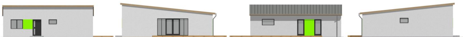
Pohled boční zleva